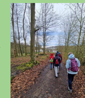
Pilgern in Ende

Ökum. Trauercafé jeden 2. Mi. im Monat, 9:30 - 11:30 Uhr, St.-Urban 10.09.; 9.10.; 13.11.2024