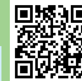
Auf Instagram: evangelisch_in_ende

Save the Date: Vom 30.4.-4.5.2025 ist der 39. Deutsche Evangelische Kirchentag in Hannover unter dem Motto „Mutig – stark – beherzt“ 1. Kor 16,13-14. Vom Kirchenkreis Hagen aus wird es wieder eine gemeinsame Fahrt geben.